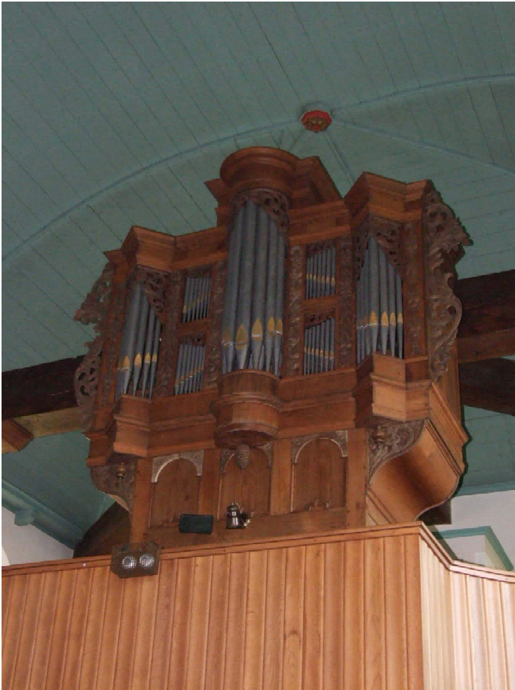
(35) orgel en balustrade