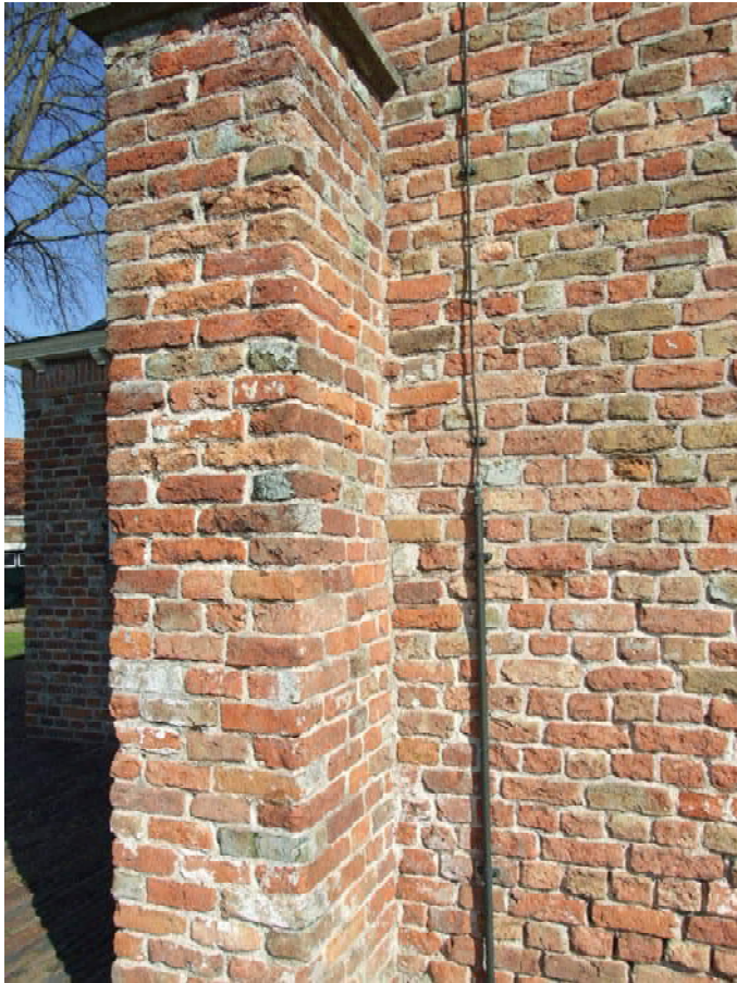
(19) overgang steunbeer- west op zuidgevel