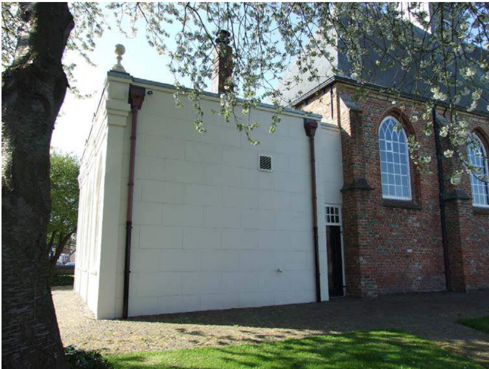
(21) noordgevel en consistorie