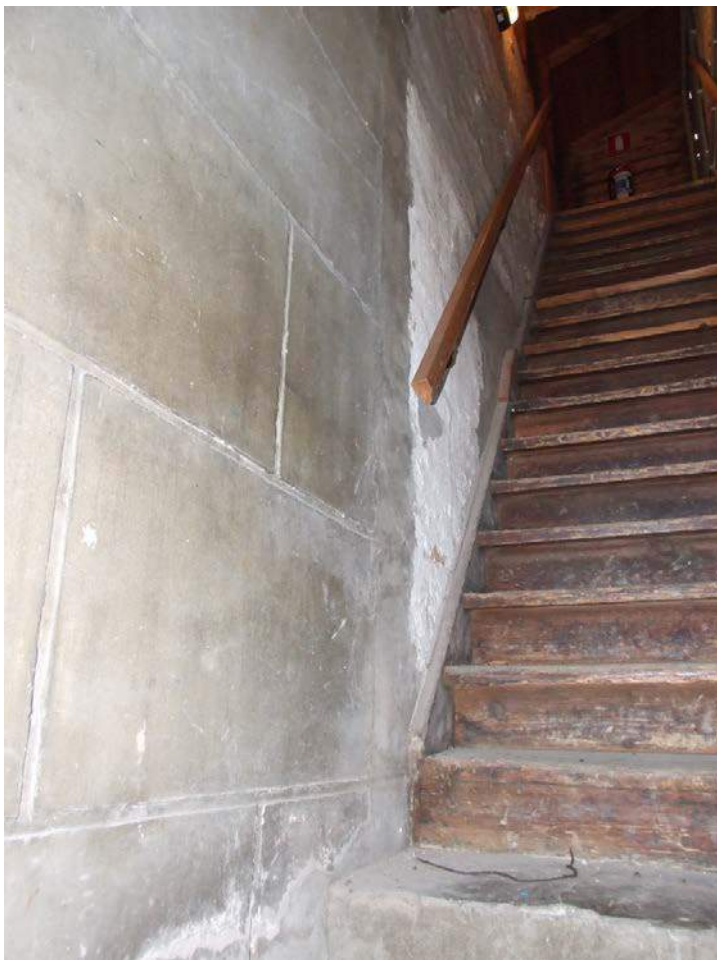
(26) consistorie zuidgevel