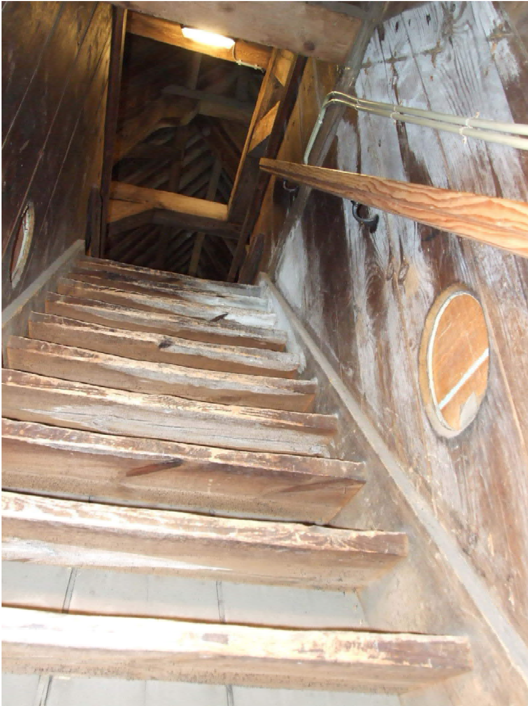
(27) zoldertrap boven preekstoel