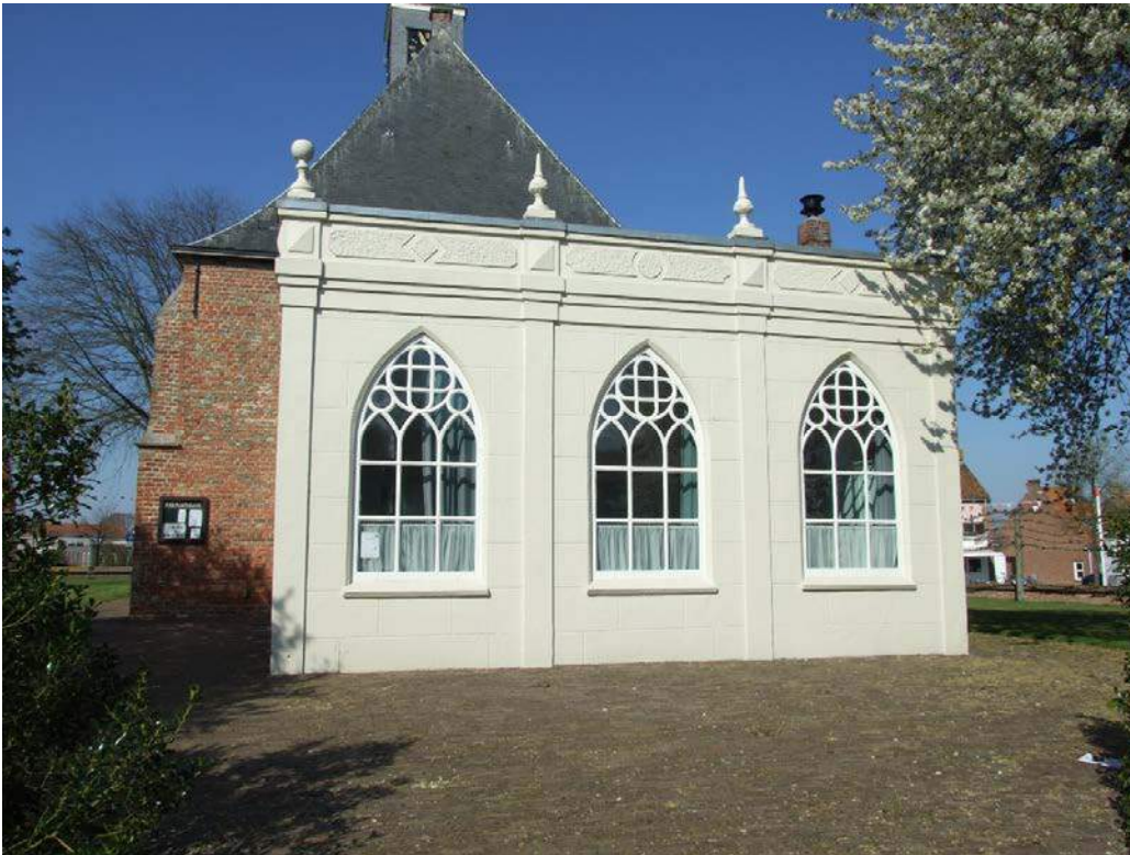
(22) consistorie oostgevel