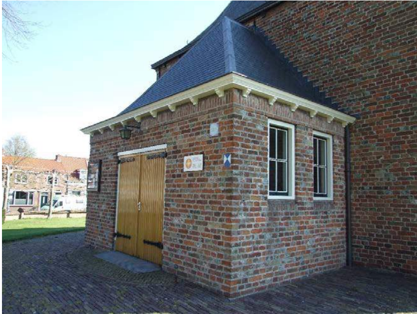
(18) entreeportaal westzijde