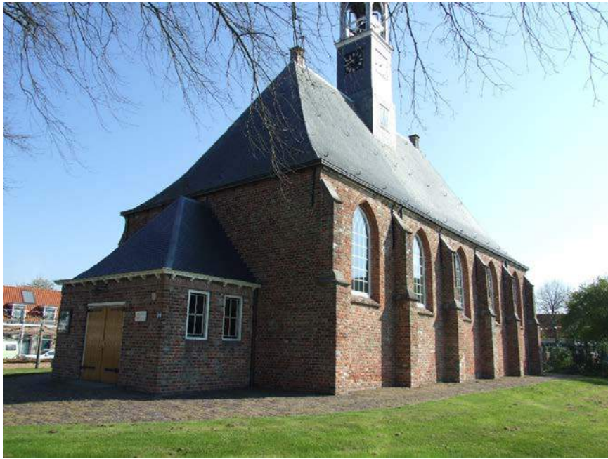
(16) west en zuidgevel