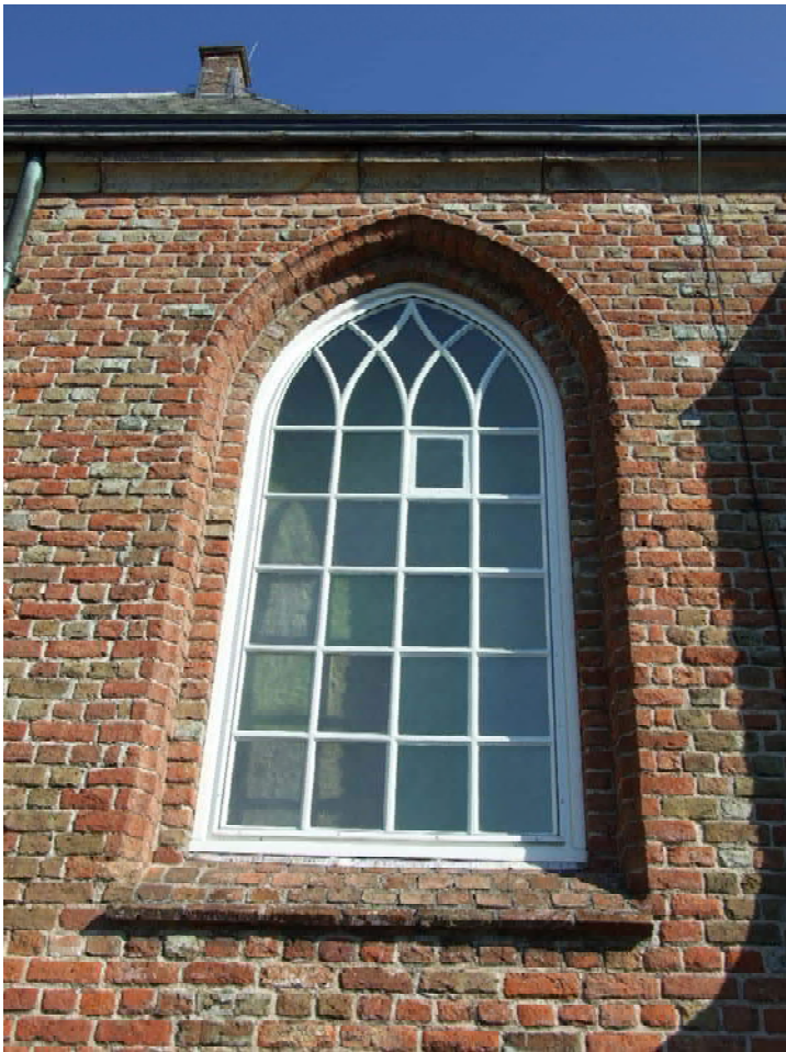
(17) zuidgevel, oostelijk venster