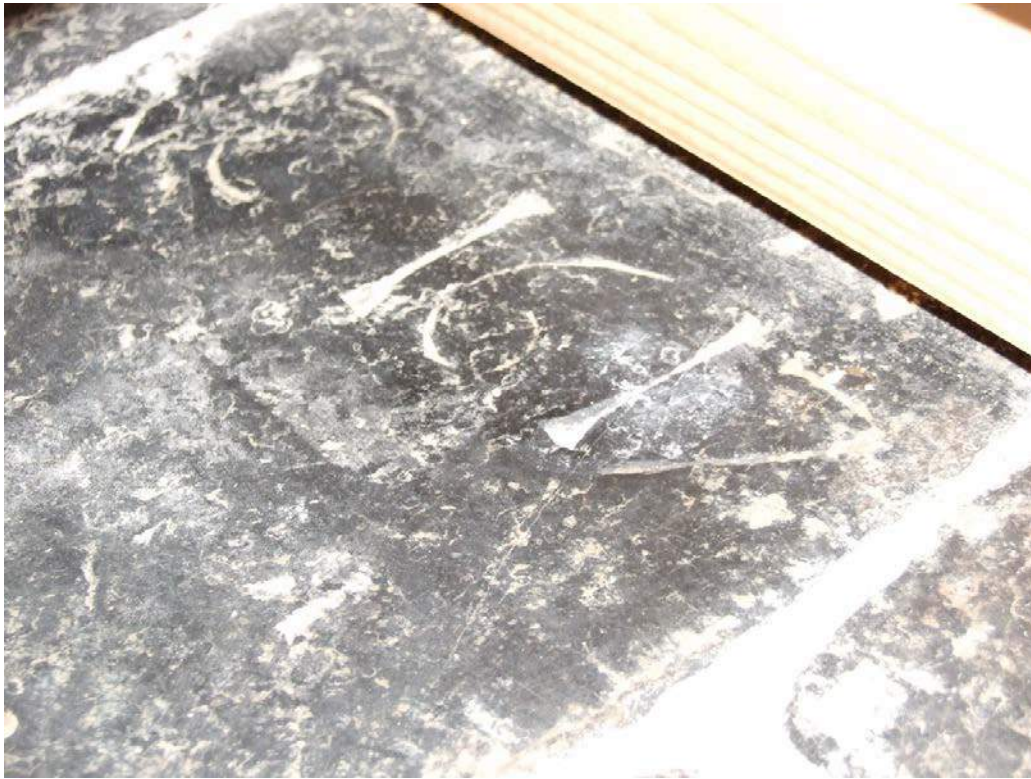
(42) restant zerk nabij de preekstoel