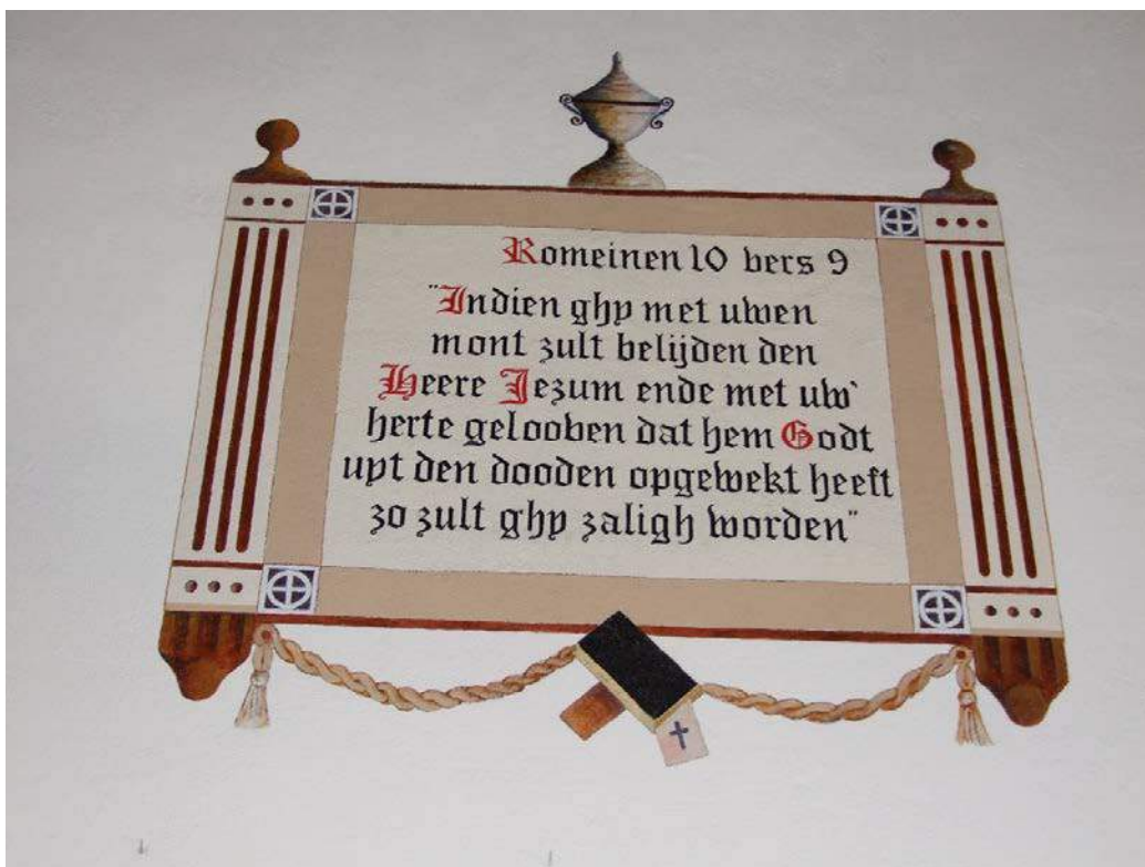
(40) muurschildering naast preekstoel