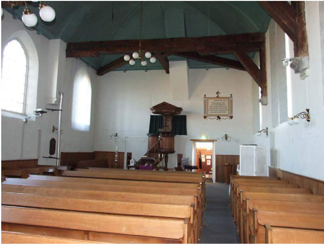
(32) kerkzaal overzicht richting oost