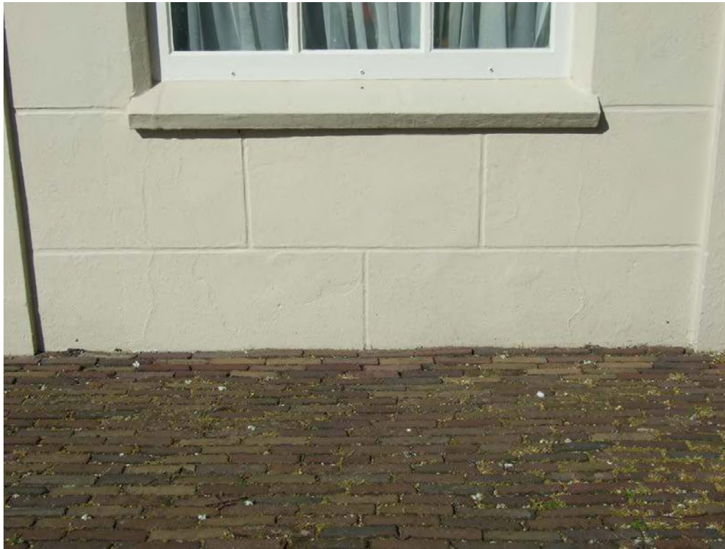
(23) bouwspoor vml toegang brandspuit stalling